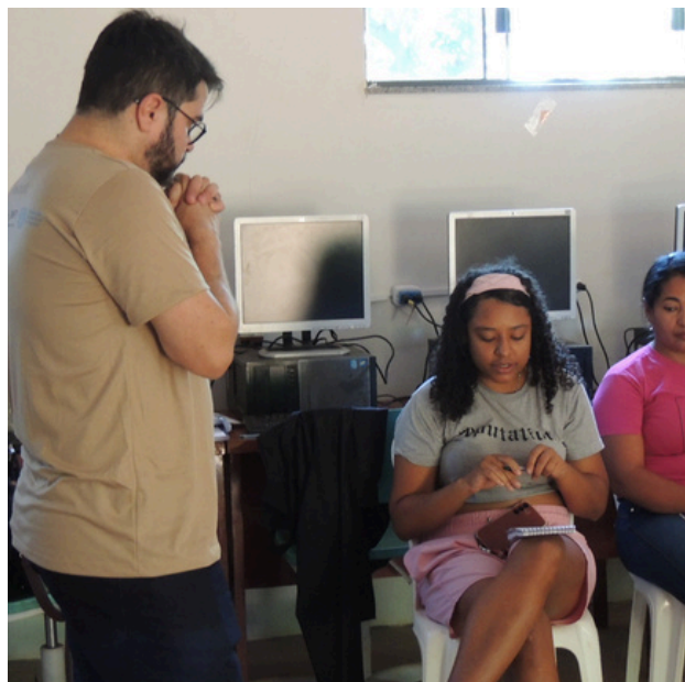
Realização do curso.