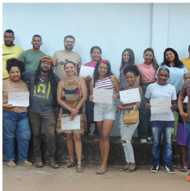
Entrega dos certificados.