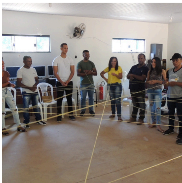
Mística de abertura.